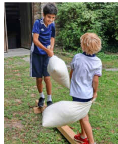
Nicht einfach, das Gleichgewicht zu halten, wenn einer mit einem Sack schlägt.

viert, auf dem verschiedene Ziele mit dem Schwert von Holzpflocken geschlagen werden müssen. Danach folgt der Umgang mit der Lanze: Ebenfalls hoch zu Steckenross muss ein hölzerner Schild beim An-